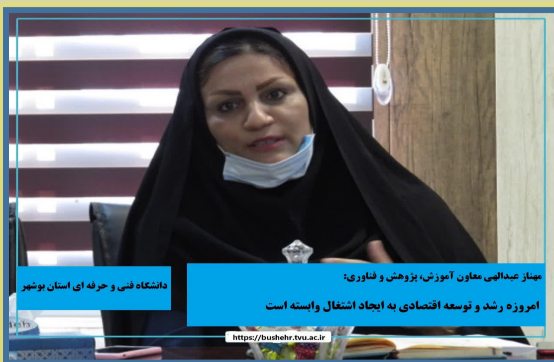
دانشگاه فنی و حرفه‌ای استان بوشهر